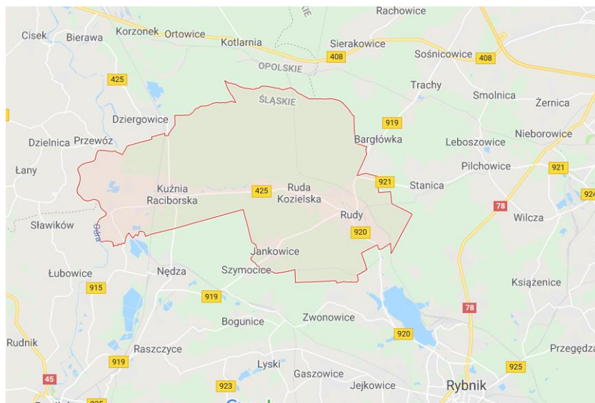
Rysunek 1. Mapa Gminy Kuźnia Raciborska.

Szczegółowa lokalizacja i inne dane dla danej lokalizacji zostały przedstawione w załączniku do PFU.