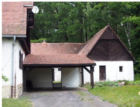
Widok zabudowań gospodarczych w kierunku NE