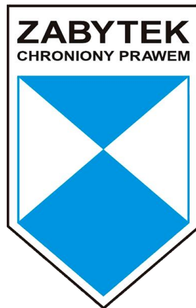
Rysunek 1. Wzór znaku informacyjnego umieszczonego na zabytkach nieruchomych wpisanych do rejestru zabytków

Do rejestru można wpisać także otoczenie, nazwę geograficzną, historyczną i tradycyjną zabytku nieruchomego wpisanego do rejestru zabytków. Wojewódzki konserwator zabytków może wpisać także do rejestru historyczny układ urbanistyczny lub ruralistyczny.