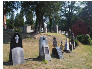
Fotografia 12. Widok na cmentarz w miejscowości Rudy