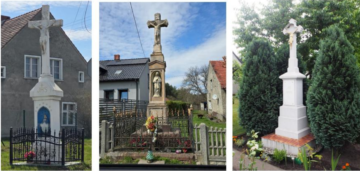
Fotografia 7. Krzyże przydrożne, od lewej: Rudy, ul. Cegielska/Rybnicka, Rudy, ul. Kolonia Renerowska 22, Kuźnia Raciborska, ul. Słowackiego 35

Krzyże przydrożne na terenie gminy znajdują się w dobrym stanie technicznym. Pielęgnowane przez mieszkańców jest również otoczenie wokół krzyży. Są objęte ochroną poprzez wpis do gminnej ewidencji zabytków.