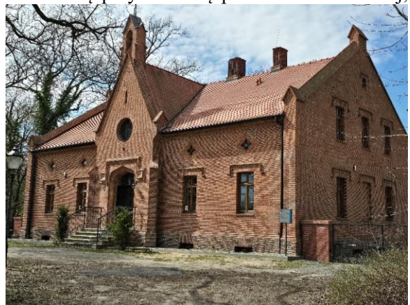
Fotografia 5. Widok na budynek szpitala w Rudach

Szpital wzniesiony ok. 1858 r. w stylu uproszczonego neogotyku. Jest pierwszym na Górnym Śląsku świeckim szpitalem związanym z działalnością doktora Juliusza Rogera. Budynek wolnostojący, murowany z cegły licowanej klinkierem. Wzniesiony na rzucie prostokąta, z kwadratową przybudówką po stronie zachodniej; jednokondygnacyjny, z poddaszem. Fasada szpitala pięciosiowa, z oszkarpowanym ryzalitem w środkowej osi, zwieńczonej trójkątnym szczytem. W ryzalicie otwór wejściowy zamknięty luką Tudorów, powyżej rozeta. Detal architektoniczny w postaci sterczyn, ceglanych gzymsów i arkadek, okienkami poddasza w kształcie czwórliścia. W przyziemiu południowej elewacji nisza z figurą Matki Bożej. Układ wnętrz przekształcony podczas kolejnych modernizacji, zachowana sień.