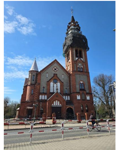
Fotografia 3. Widok na kościół pw. św. Marii Magdaleny

Obiekt jest objęty ochroną poprzez wpis do Gminnej Ewidencji Zabytków.