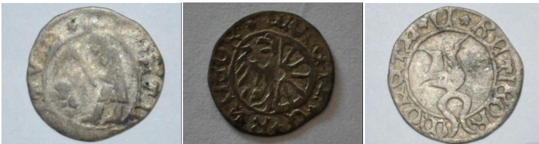
Fot. odnalezionych monet

Jednym z ciekawszych znalezisk na terenie gminy był skarb ok. 255 monet z XIII-XIV w. w Rudach - Kolonii Renerowskiej (AZP 100-42, 1-1) 3 . Skarb monet w skład którego wchodziły halerze raciborskie, cieszyńskie, moneta bytomska i grosze praskie, znalezione zostały w 1965 r. ok. 1500 m na północny zachód od wschodniego krańca wsi Kolonia Renerowska, na terenie zalesionym. Przypadkowo odkryte monety zdeponowane zostały w dwóch glinianych naczyniach. Dokładna lokalizacja odkrycia nie jest znana. Monety przekazane zostały do Muzeum w Raciborzu (nr inw. MR.557), gdzie otrzymały nazwę „Skarbu Janowickiego”.