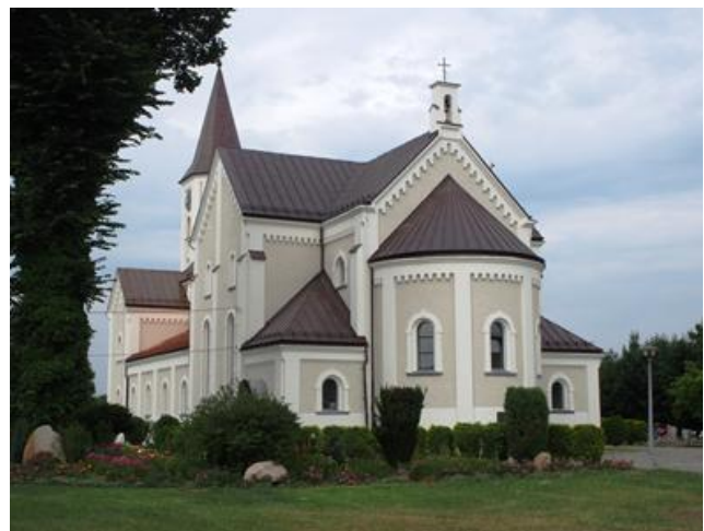
Fotografia 4. Widok na kościół pw. Najświętszego Serca Pana Jezusa