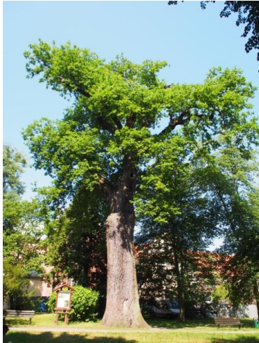
Dąb szypułkowy „Cysters”