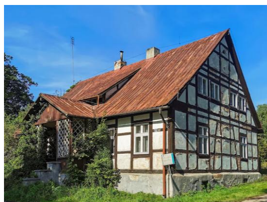
Fotografia 6. Widok na leśniczówkę Krasiejów

Budynek leśniczówki na planie prostokąta, murowany, podpiwniczony, jednokondygnacyjny, z poddaszem, kryty dachem dwuspadowym. Konstrukcja budynku z wykorzystaniem muru pruskiego. Pokrycie dachowe z blachy. Zachowana drewniana stolarka okienna i drzwiowa. Część frontowa posiada przedsionek z werandą, z drewnianą kratownicą.