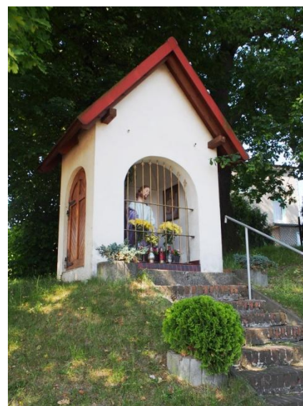
Rudy, ul. Cegielska/ ul. Brzozowa