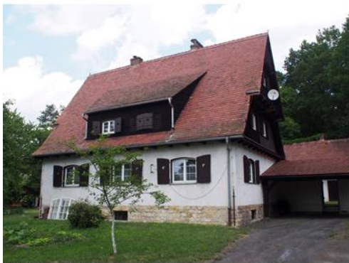
Widok w kierunku północnym