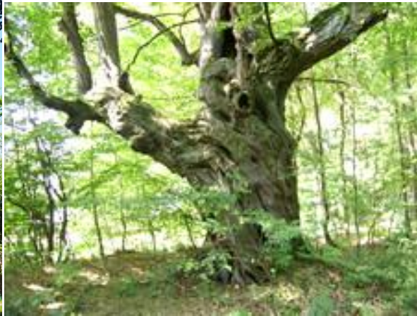
Grab zwyczajny, leśnictwo Krasiejów 1