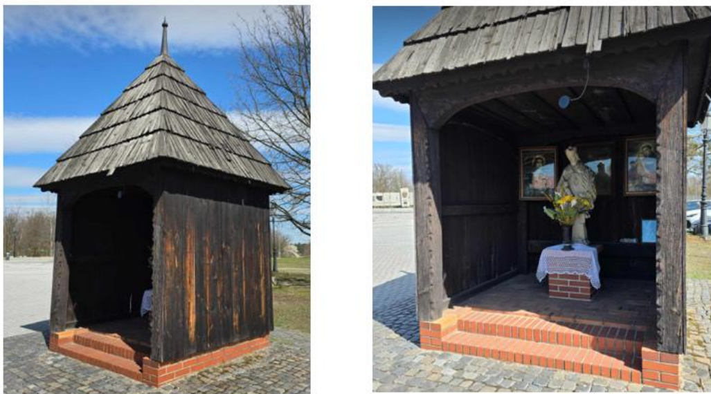
Fotografia 8. Kapliczka św. Jana Nepomucena w Kuźni Raciborskiej

Cennymi zabytkami są figury św. Jana Nepomucena, z których trzy znajdują się w ewidencji: w Kuźni Raciborskiej na Placu Mickiewicza oraz w Rudach przy ul. Cysterskiej oraz na rogu ulic Polnej i Świętojańskiej. Figura św. Nepomucena znajduje się także w drewnianej kapliczce przy kościele w Kuźni Raciborskiej, ujętej w rejestrze zabytków. Zlokalizowana w centrum miejscowości, blisko kościoła i szlaku komunikacyjnego – stanowi ważny punkt orientacyjny i element przestrzeni publicznej.