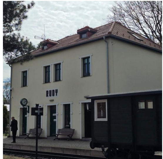
Fotografia 13. Widok na budynek rekonstrukcji dworca

Przebudowany budynek dworca w Rudach zbudowany jest na rzucie prostokąta, o zwartej, dwukondygnacyjnej bryle krytej czterospadowym dachem. Zespół budynków lokomotywowni, kuźni, warsztatów i wagonowni usytuowany jest w północnej części stacji, po wschodniej stronie torów. Jest zbudowany z cegły, nietynkowany, na rzucie wieloboku złożonego z prostokąta mieszczącego lokomotywownię z kuźnią, skrzydła wschodniego mieszczącego warsztaty, ze ściętym narożnikiem północno-wschodnim. Do głównej bryły przylegają mniejsze przybudówki, kryte zróżnicowanymi dachami o niewielkim kącie nachylenia. Wnętrze lokomotywowni i warsztatów jednoprzestrzenne, z kanałami napraw, w pozostałych częściach podzielone na pomieszczenia. Budynek dyspozytorni jest murowany z cegły, jednokondygnacyjny, na rzucie prostokąta, kryty dachem dwuspadowym. Frontowa, zachodnia elewacja siedmioosiowa, z wejściem w środkowej osi. Budynek warsztatów położony jest na południe od dyspozytorni i na południowy wschód od lokomotywowni. Zbudowany jest w konstrukcji szkieletowej z ceglany wypełnieniem. Na rzucie wydłużonego prostokąta, jednokondygnacyjny, kryty dachem dwuspadowym.