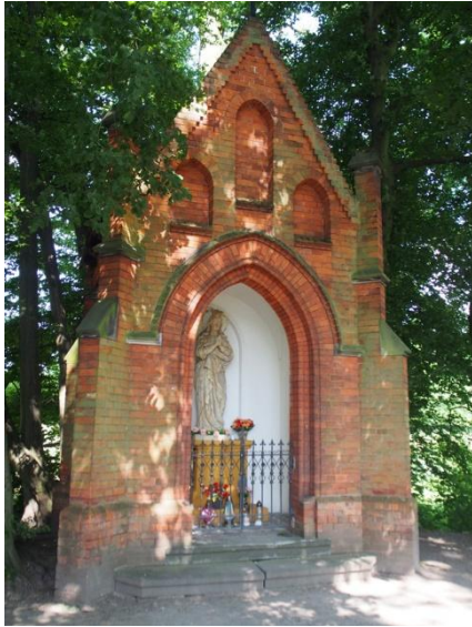
Rudy, kapliczka w parku