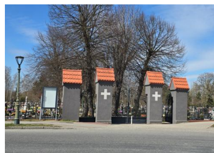
Fotografia 10. Widok na bramę cmentarza w Kuźni Raciborskiej

Cmentarz jest objęty ochroną poprzez wpis do Gminnej Ewidencji Zabytków.