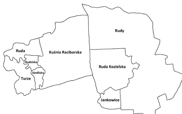
Rysunek 3. Podział terytorialny gminy Kuźnia Raciborska