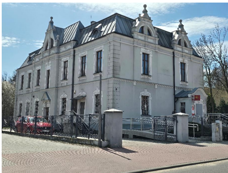
Fotografia 15. Reprezentacyjna willa przy ul. Powstańców 9 w Kuźni Raciborskiej

Przykładem budownictwa o cechach reprezentacyjnych są wille w Kuźni Raciborskiej przy ul. Powstańców 5 i 9, z czego ta druga powstała jako siedziba poczty, na miejscu starszego budynku. Także w Kuźni Raciborskiej znajdują się kamienice przy placu Mickiewicza nr 12 i 14, w typie wielorodzinnej zabudowy małomiasteczkowej.