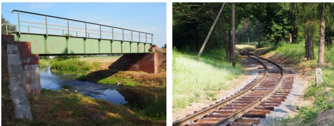
Fotografia 14. Widok na układ torowy, most stalowy na rzece Ruda