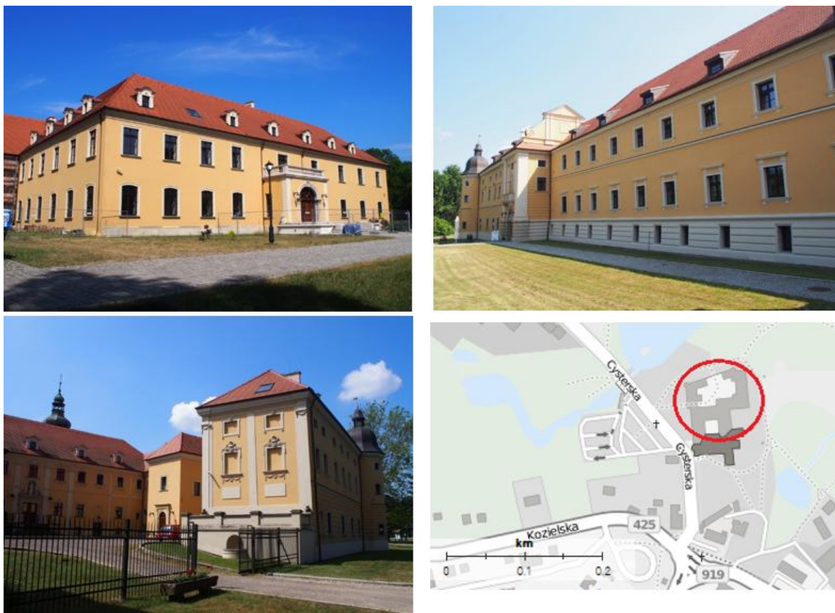
Fotografia 2. Widok na klasztor w Rudach

Park krajobrazowy został założony w XVIII w. Obecny układ pochodzi z ok. 1849 r., park rozciąga się na północ i wschód od zespołu pałacowo-klasztornego.